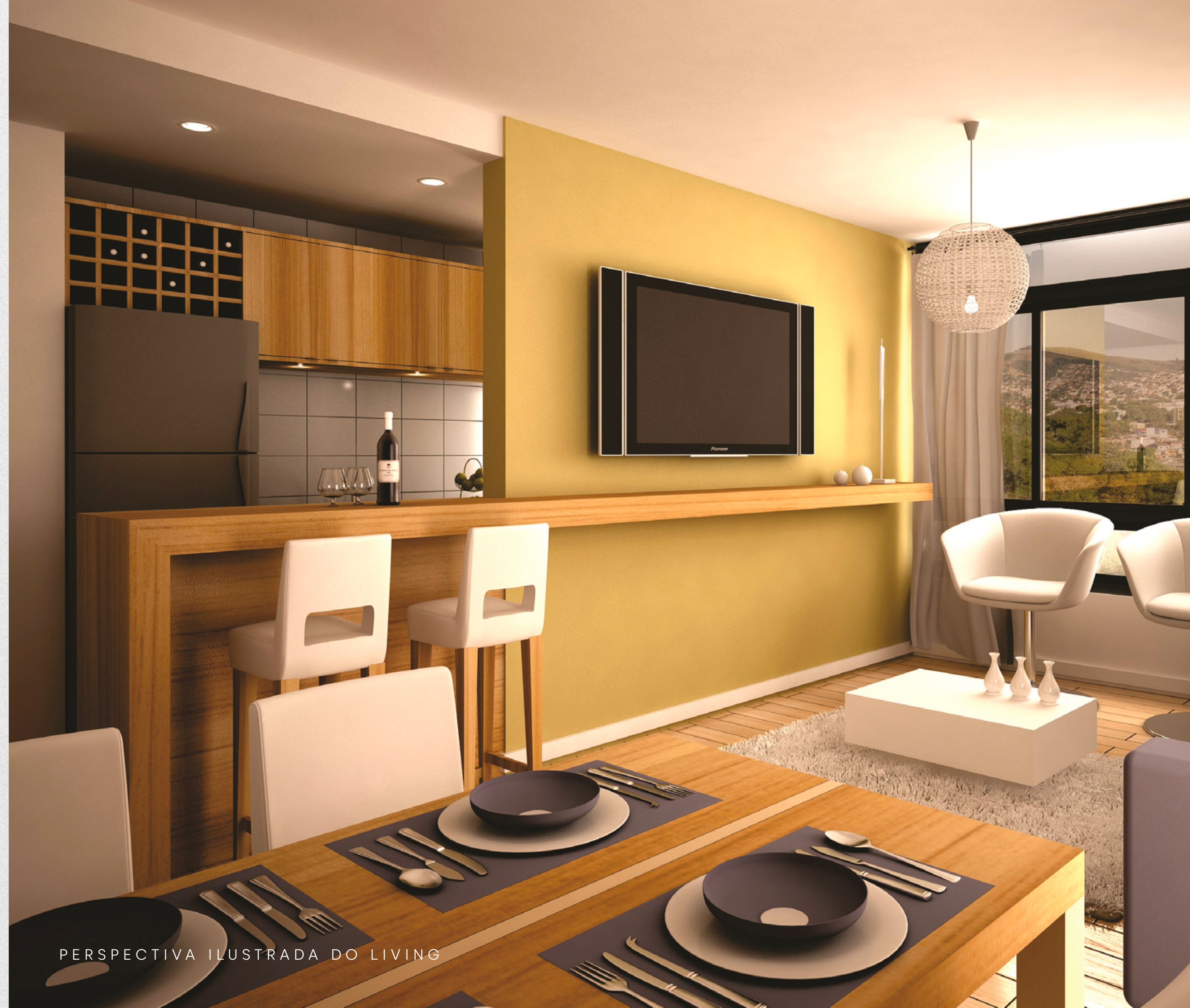
PERSPECTIVA ILUSTRADA DO LIVING