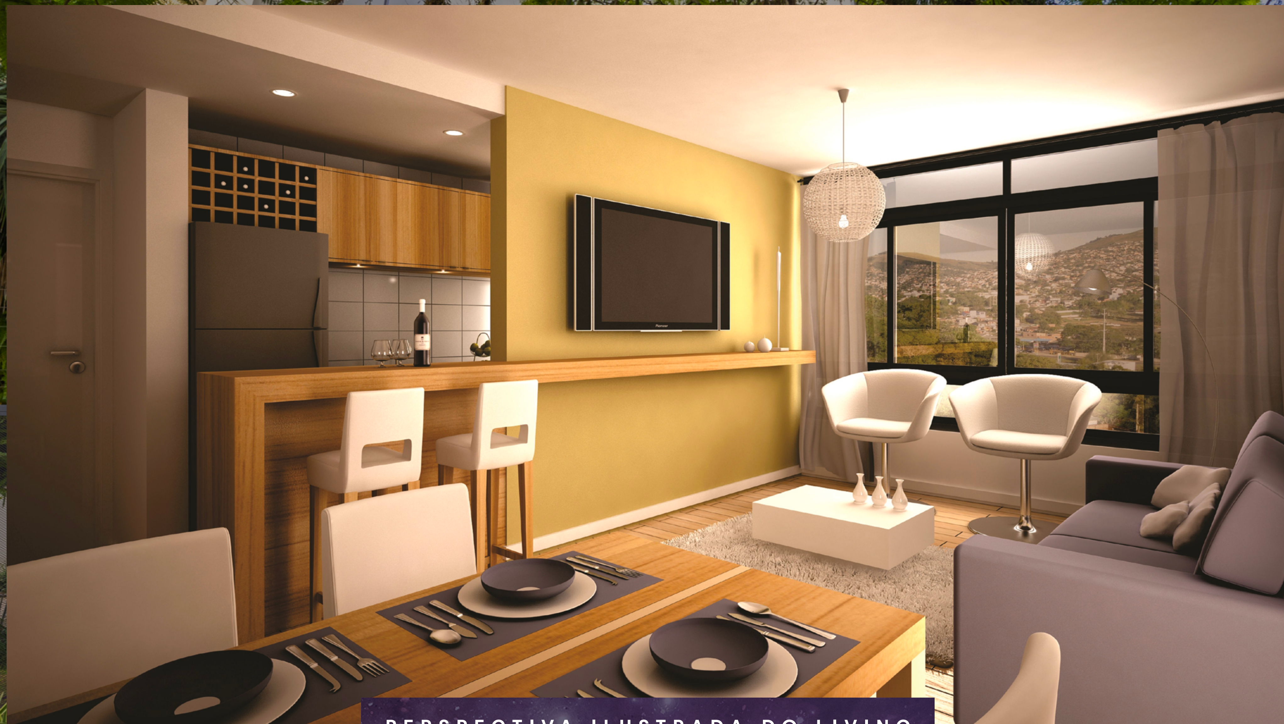
PERSPECTIVA ILUSTRADA DO LIVING