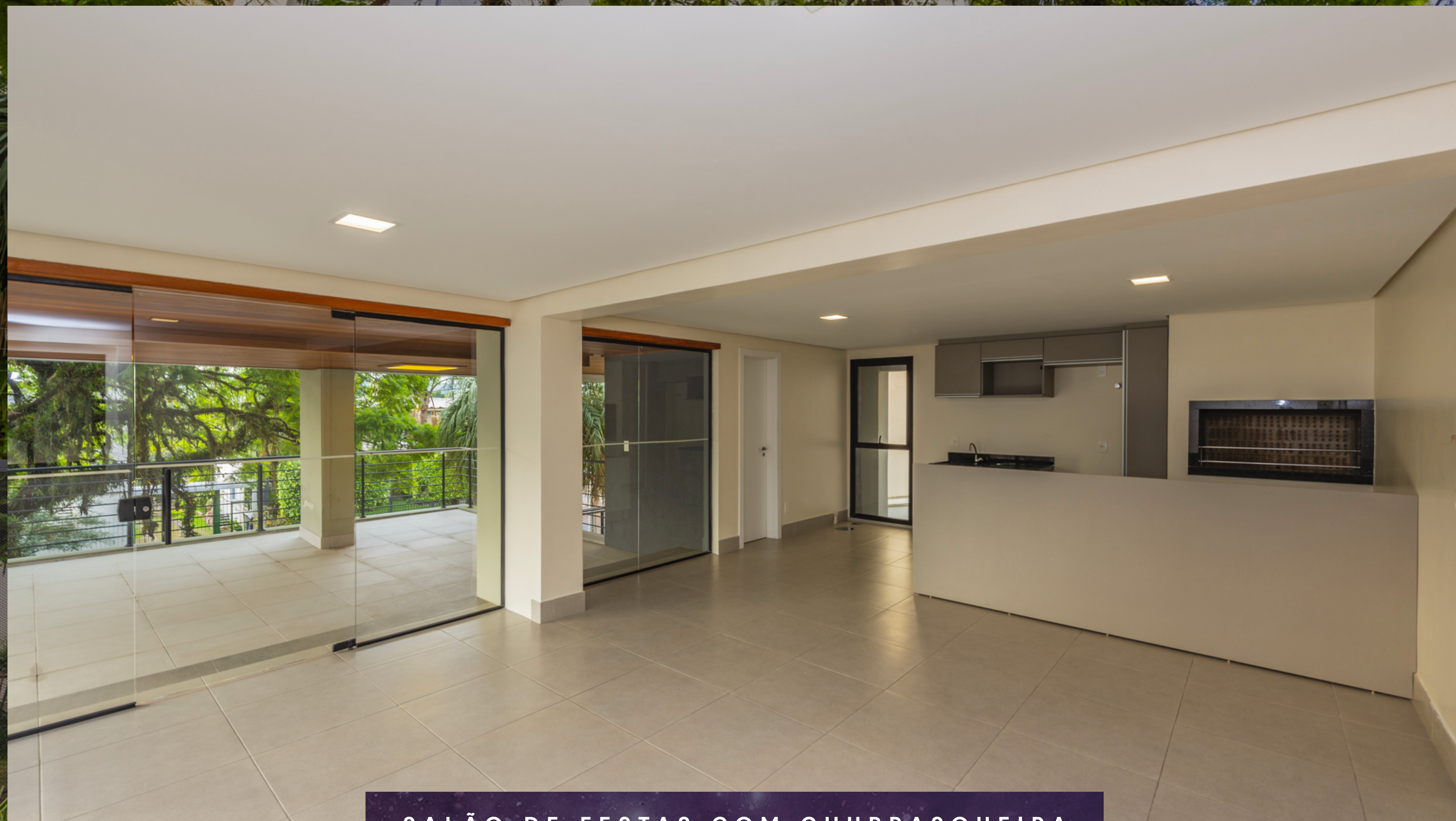
SALÃO DE FESTAS COM CHURRASQUEIRA