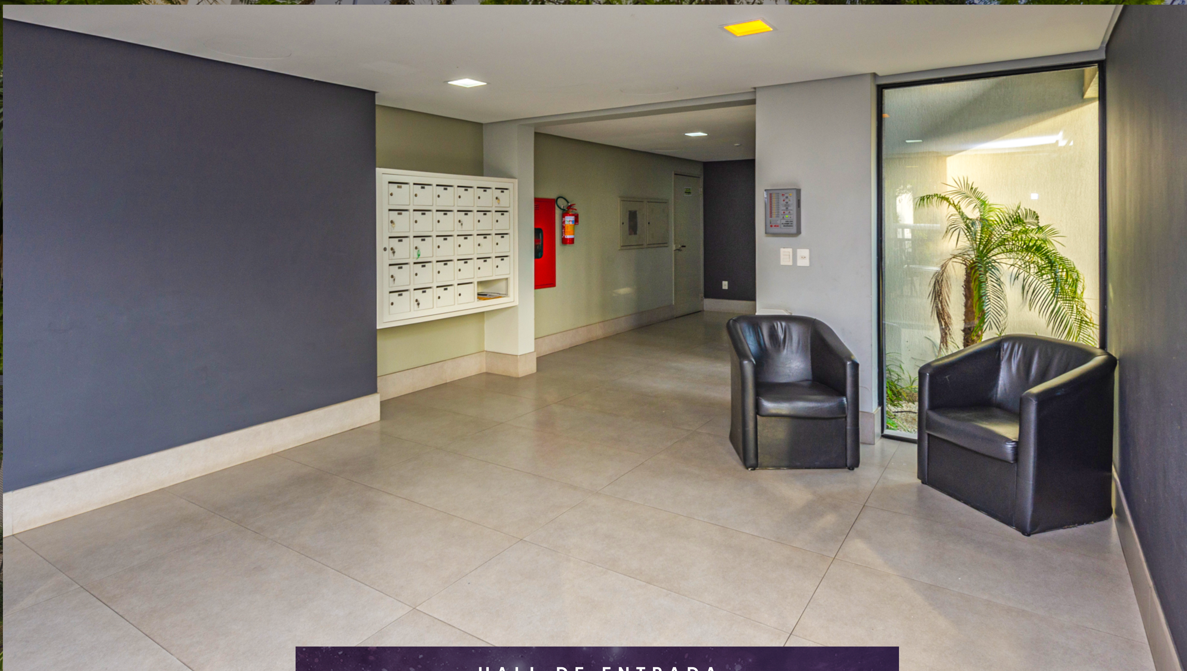
HALL DE ENTRADA