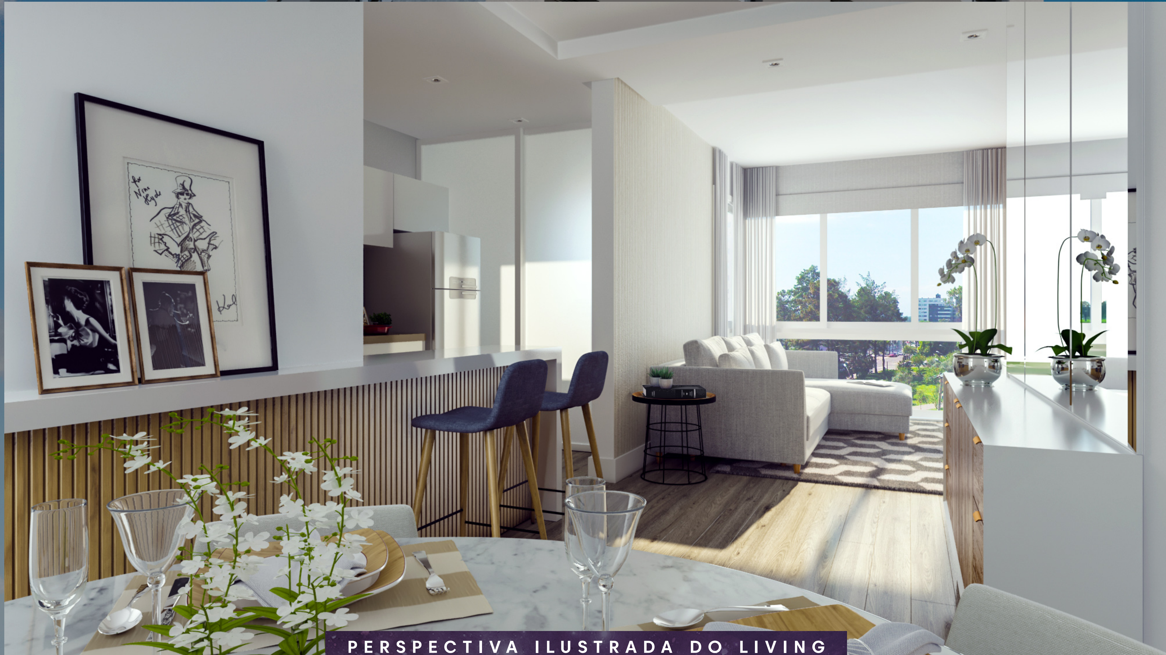
PERSPECTIVA ILUSTRADA DO LIVING DO APARTAMENTO FINAL 1