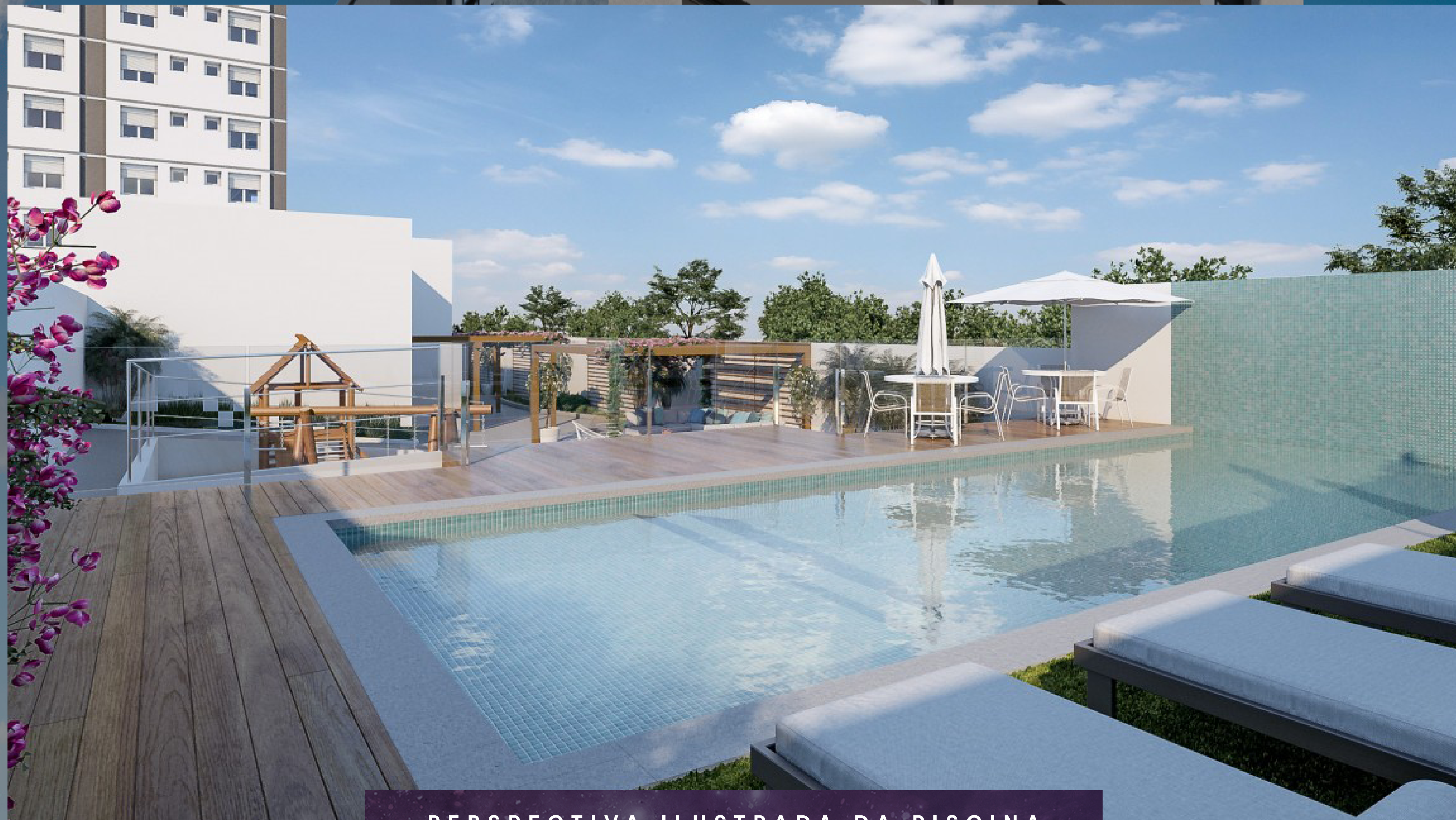
PERSPECTIVA ILUSTRADA DA PISCINA