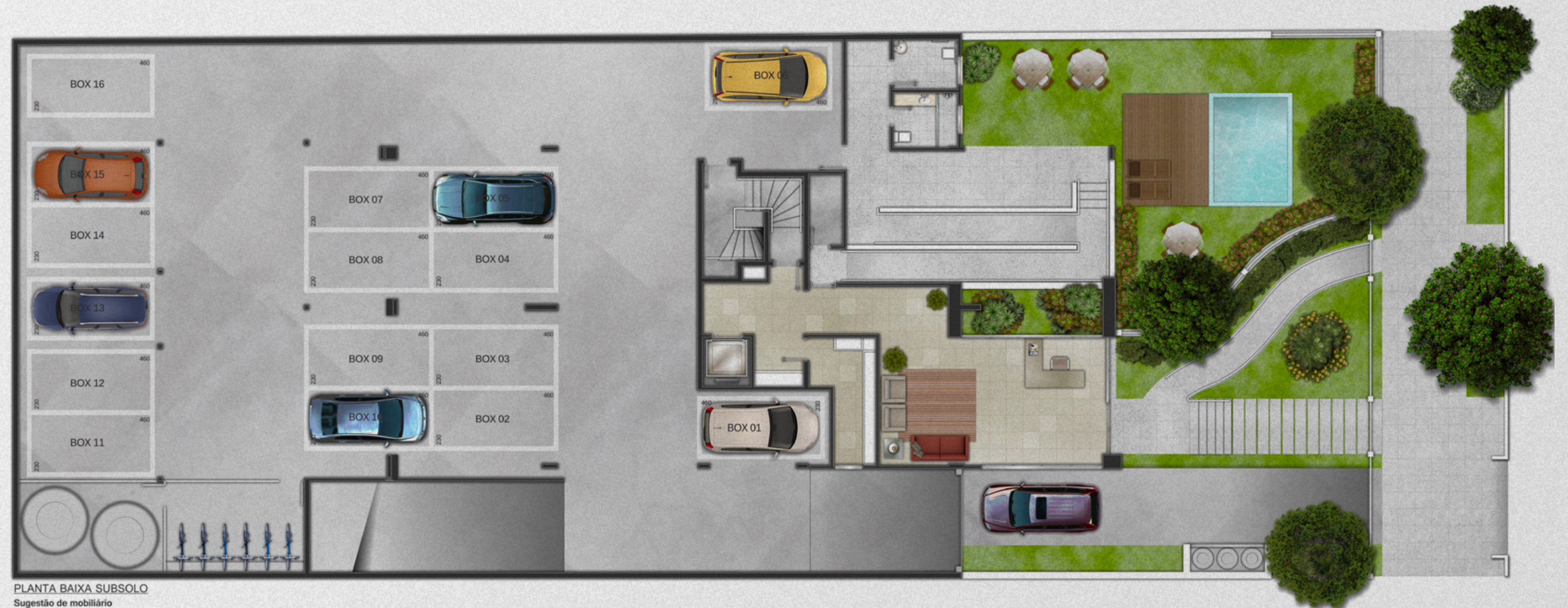
PLANTA BAIXA SUBSOLO Sugestão de mobiliário