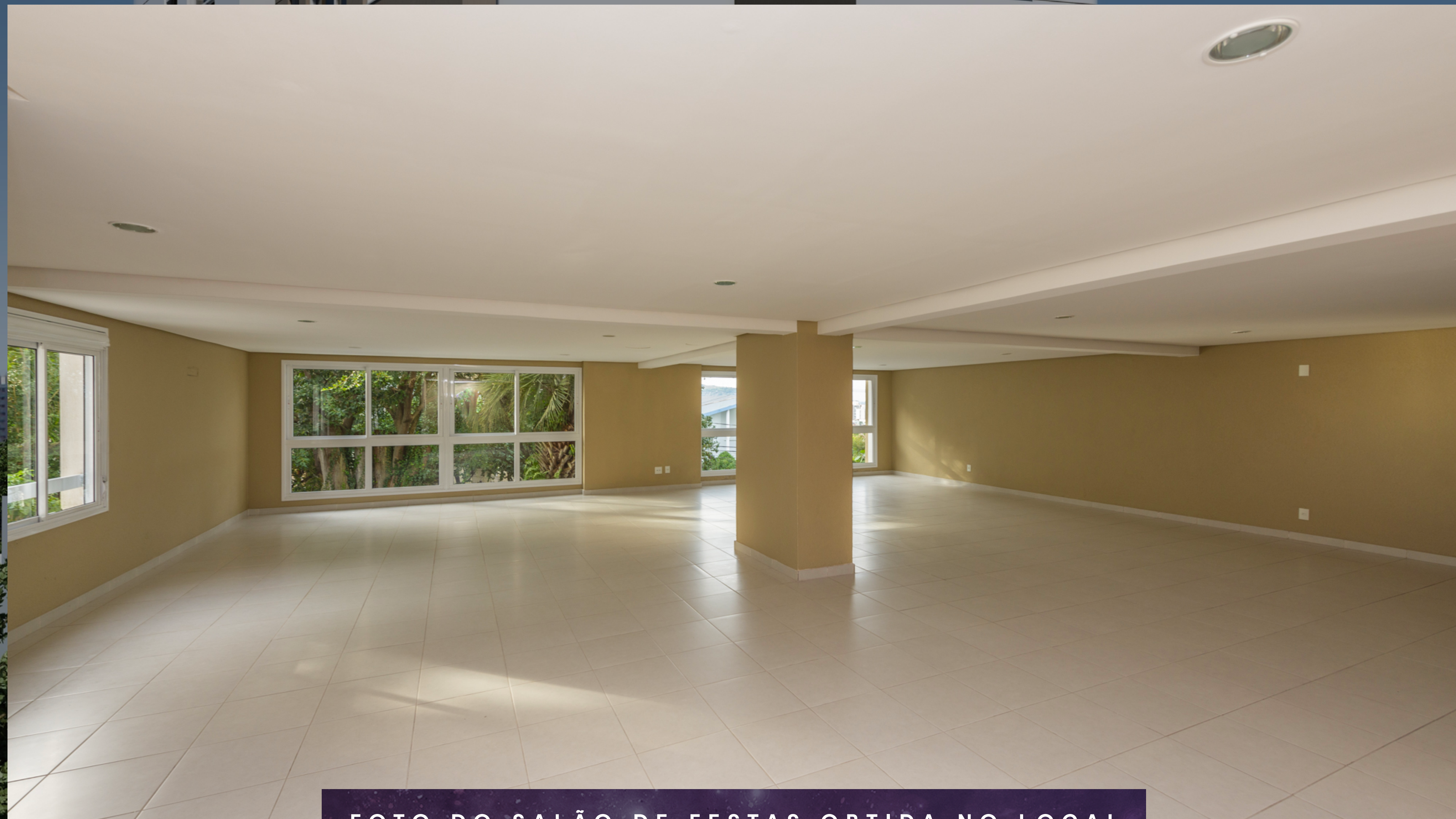
FOTO DO SALÃO DE FESTAS OBTIDA NO LOCAL